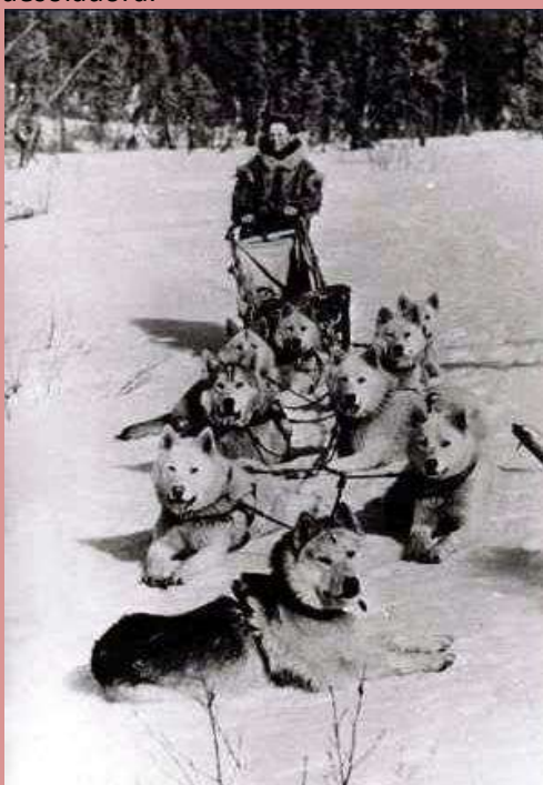
Leonard Seppala y su equipo de trineo

Las fuertes ventiscas y condiciones climáticas eran terribles, el único medio de transporte era el trineo tirado por perros. El correo de Trineos de Norteamérica tardaría 25 días en realizar este trayecto. Y para ese momento toda la población se veía afectada con la epidemia. La situación era desoladora.