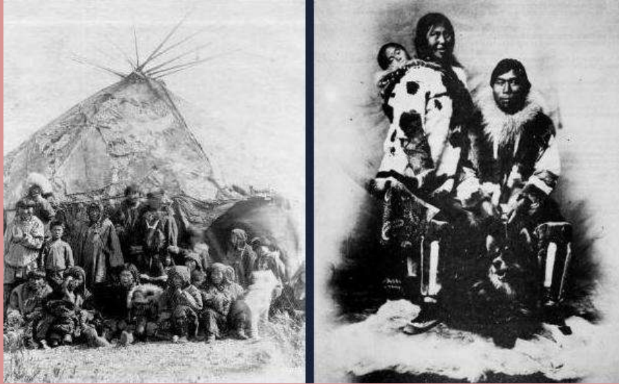
Los Ciuckis, éstos eran un pueblo nómada que habitaban en la cuenca del río Kolima en la zona más cercana a Alaska.