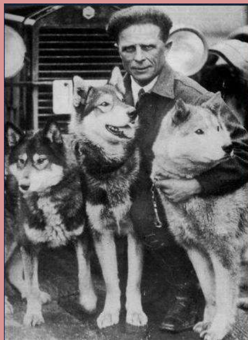
Leonard Seppala y sus Siberian Huskys

Seppala se comprometió en entregar el suero en no más de 6 días. Organizo el transporte con la ayuda de otros MUSHERS, dejando para el tramo más largo y peligroso. De las 658 millas el recorrería 340. El trayecto se cubrió en cinco días y medio y el suero llego a tiempo para salvar a toda la población.