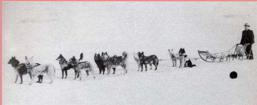
Estos son los ejemplares de comenzaron la historia

Tanto así, que ese mismo año importo tres jaurías, que comenzó a entrenar de inmediato. Seguro de sus perros, los inscribió en la carrera de 1910, el resultado fue APLASTANTE ya que los perros de los CIUCKIS clasificaron en 1°, 2° y 4° puesto.