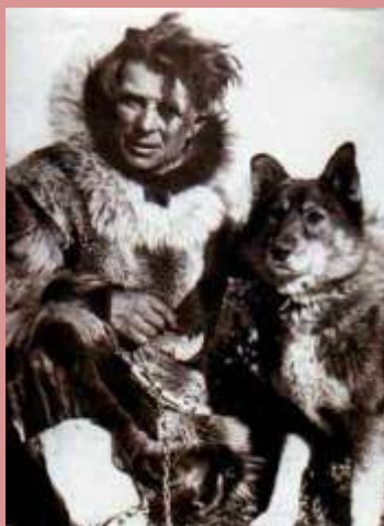
Leonard Seppala y Togo

Seppala trataba a sus perros con mucho cariño. Hablaba con cada uno de ellos y los perros le obedecían incluso en los momentos más difíciles. Se encargaba personalmente de su alimentación, curarlos y también de ahorrarles esfuerzo.