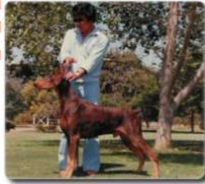
Am. Ch. Marienburg’s Sun Hawk

También tuvo su contribución para el mayor reproductor de la raza, “Sun Hawk”, quién tenía sus principales hijos campeones de hembras hijas de “Demetrius”.