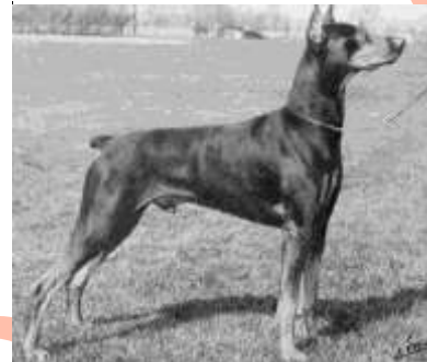
Am.Ch. Damasyn The Boatswain

Otro gran nombre en su pedigree fue Rancho Dobe's Storm, el fue el único Dobermann en toda la historia en vencer dos veces el B.I.S. en Westminster.