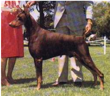
Am. Ch. Electra’s The Wind Walker

Con los mayores reproductores en su pedigree “Meats” fue padre de 54 Am.Ch., siendo reproductor número 2 de la raza por 10 años, teniendo apenas 1 hijo menos campeón que “Delegate” (3 veces en su pedigree), otro Dobermann que tuvieron más de 45 hijos campeones eran ascendentes o fueron sus descendientes como es el caso de Am.Ch. Electra’s Wind Walker “Morgan”, posee el 25 % de “Demetrius” en su pedigree.