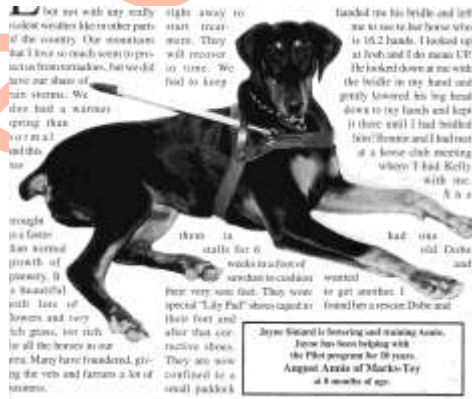
Ejemplar Annie con 8 meses de edad en entrenamiento